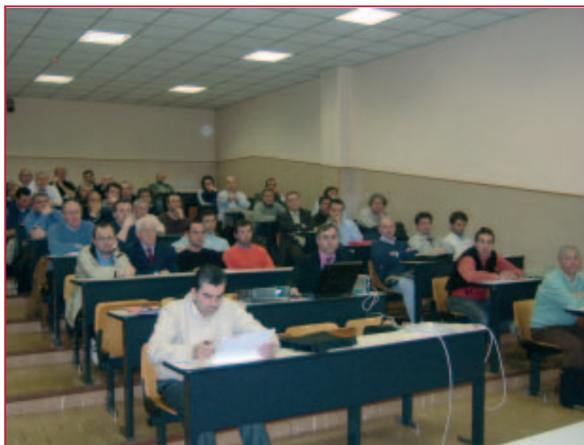
Allenatori in seduta di aggiornamento nell'abituale sala riunione dell'Istituto Tecnico Industriale Quintino Sella di Biella