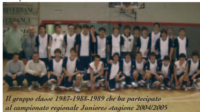
Il gruppo classe 1987-1988-1989 che ha partecipato al campionato regionale Juniores stagione 2004/2005